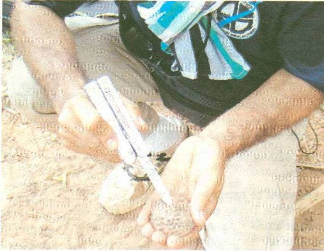
Sur place, les membres de l'association prennent toutes les précautions afin de ne pas voir les mines exploser.