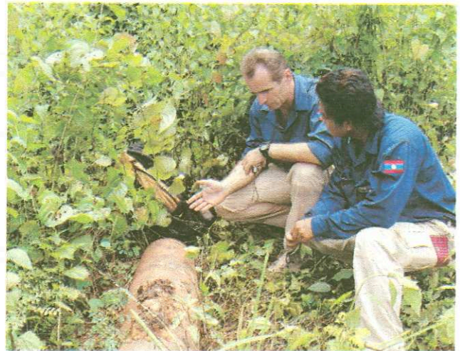
La formation, un outil indispensable pour les populations locales, comme ici au Laos en 2005.

des achats de chaînes roulantes, de prothèses, ou encore des séances de rééducation. Tout un programme nécessaire au bien-être d'une population frappée par la guerre.